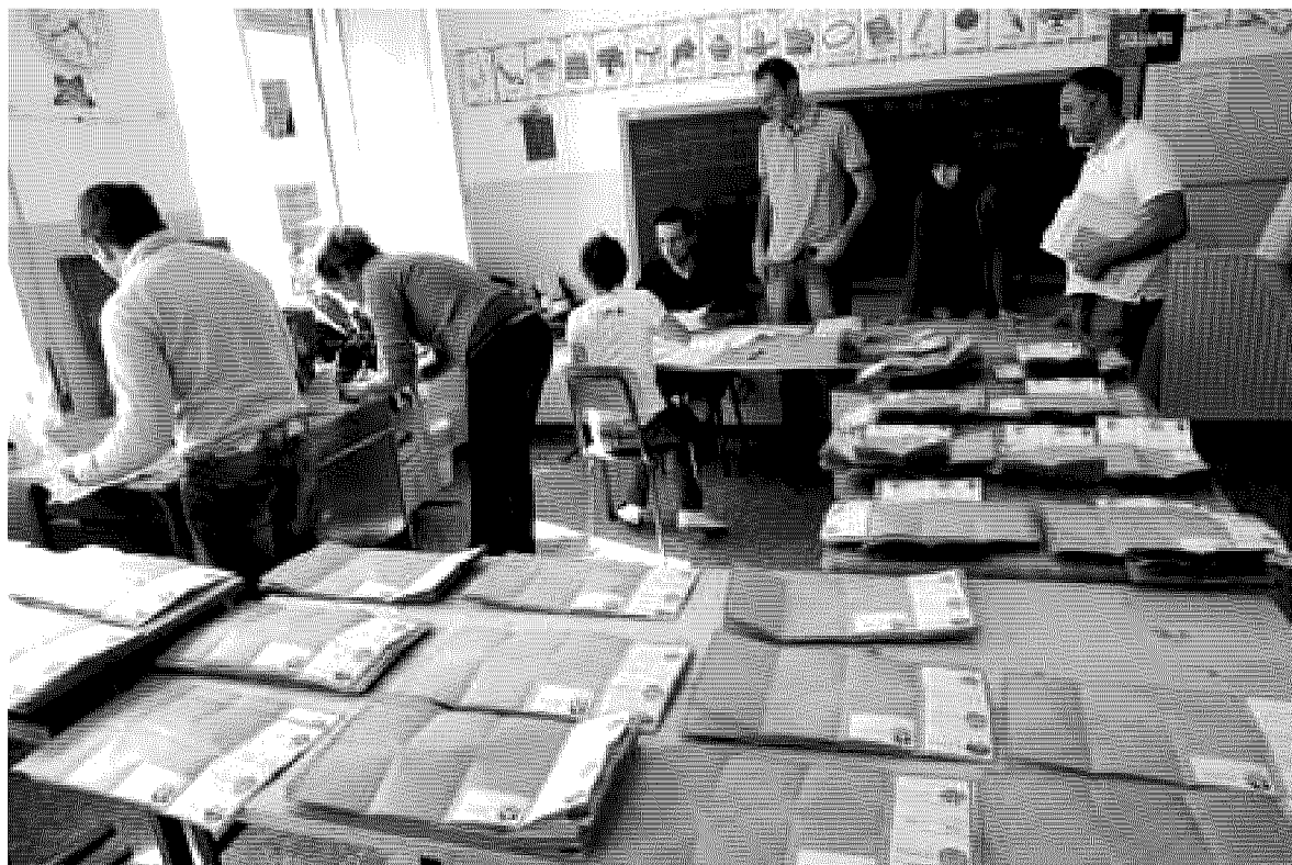
Lo spoglio delle schede in un seggio della Fontanabuona